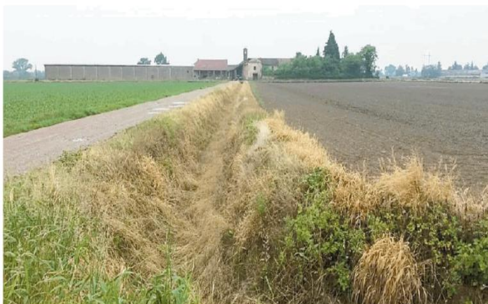
Quadro poco rassicurante sull'uso in provincia di erbicidi in agricoltura

Nel documento della Regione si sottolinea che «mentre seppur in un contesto di ampia diffusione di significati-