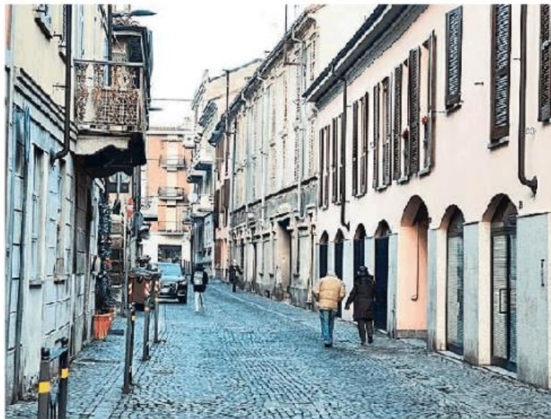
Via Cairoli, dove inizieranno i lavori per la fognatura

N on c'è pace per via Piacenza e dopo i disagi per i lavori al ponte Rosso, da domani i problemi al traffico lungo la direttrice che collega Voghera a Montebello potranno nascere da un nuovo intervento. A rallentare i veicoli per ben due mesi sarà il senso unico, previsto dal 10 gennaio sino al 10 marzo, per la posa delle tubazioni della rete fognaria come indicato da un'ordinanza comunale. Il tratto interessato è quello compreso tra il civico 176 e il confine comunale, verso Montebello, limitatamente alle porzioni di volta in volta interessate dai lavori. Le novità comportano l'introduzione del limite di 30 chilometri orari e dal lunedì al venerdì, nella fascia oraria compresa