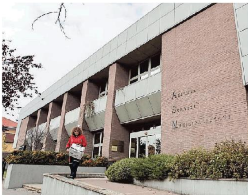
La sede della holding Asm Vigevano e Lomellina

Dando, però, per scontata una cessione, magari con prescrizioni, resta poi il problema di cosa fare con quei soldi. «Bisogna capire se la cifra resterà in pancia alla holding o potrà essere passata ai comuni soci, ovvero soprattutto il Municipio di Vigevano – prosegue Iozzi. – Asm Vigevano e Lomellina ha già investito sulle infrastrutture. Di rete, in questo caso, ma potrebbero fare la differenza fra qualche anno. Con una città