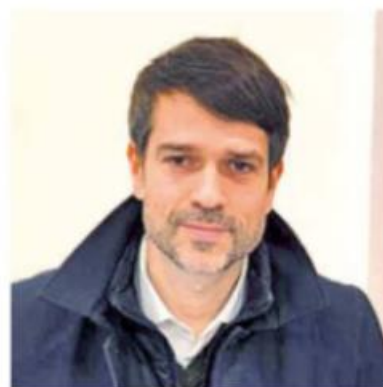
Il presidente Giovanni Palli

VALORIZZAZIONE DEL CAPITALE UMANO. «Sono almeno due le linee di intervento immediate e prioritarie sulle quali lavorare fin da subito: la riorganizzazione interna dei servizi per l'impiego e le politiche attive del lavoro della Provincia; il rafforzamento degli investimenti sull'edilizia scolastica, a partire dai fondi Pnrr e le risorse regionali, per la costruzione e/o la ristrutturazione degli edifici scolastici ad impatto energetico zero. In questa direzione abbiamo, già nei primi giorni, concluso alcune progettazioni ed abbiamo av-