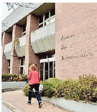
La sede dell'Asm Vigevano

Alla fine sono ben dodici le candidature presentate entro i termini in Comune per il nuovo organismo di amministrazione di Asm Vigevano e Lomellina. Con la conclusione del trasferimento delle lettere dal Protocollo alla segreteria del sindaco (il bando infatti è stato avviato da quest'ufficio), il numero dei candidati è