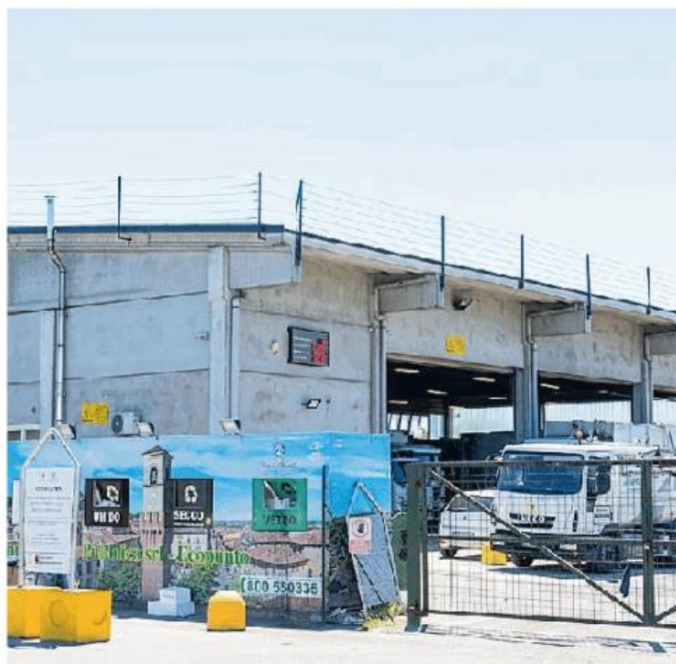
Il deposito dei mezzi della Broni-Stradella