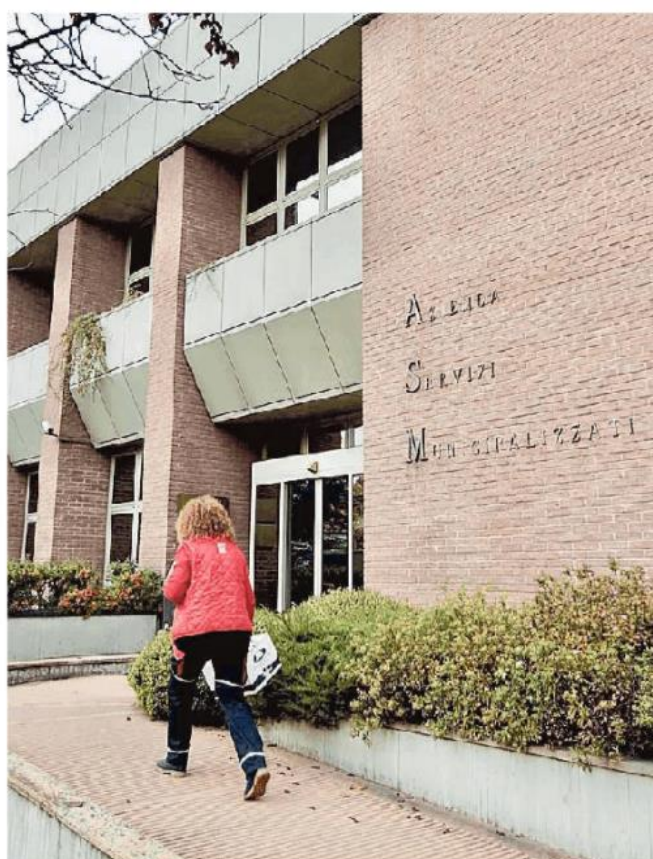
La sede di viale Petrarca di Asm Vigevano e Lomellina