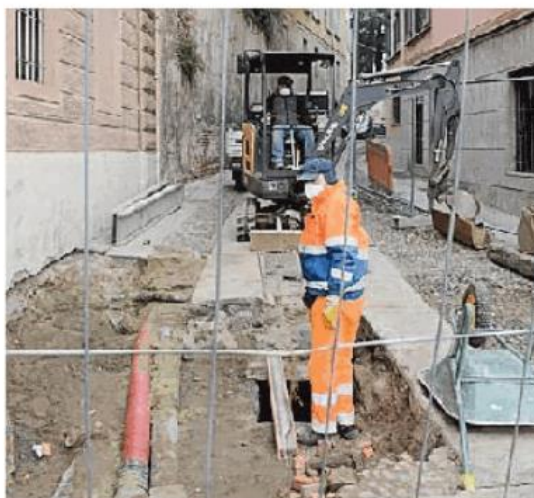
Il cantiere in via Volta

Si sono verificati cedimenti nella fognatura di via Volta e la strada resterà chiusa per tre settimane a causa dei cantieri. PRATO / APAG. 13