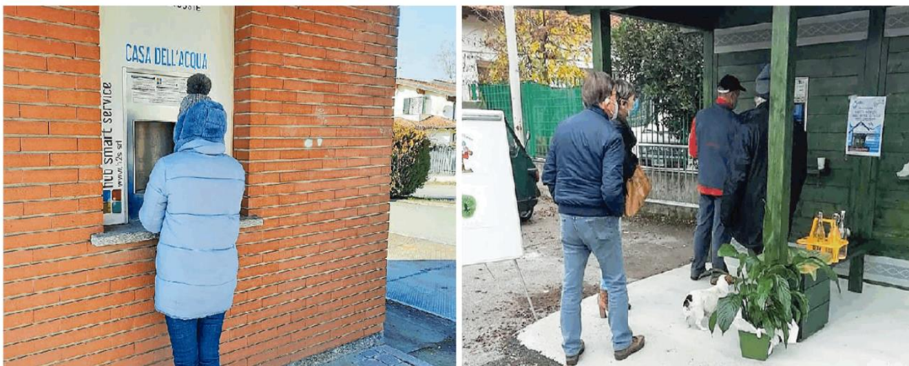
A sinistra la casetta dell'acqua di Torrazza Costa, a sinistra quelle di Lungavilla. L'unica città dove i dati sono negativi è la capitale dell'Oltrepo, Voghera

In Oltrepo aumentano i consumi, ottimi risultati a Codevilla, Torrazza Coste e Lungavilla. Presto altre quattro postazioni anche a Broni