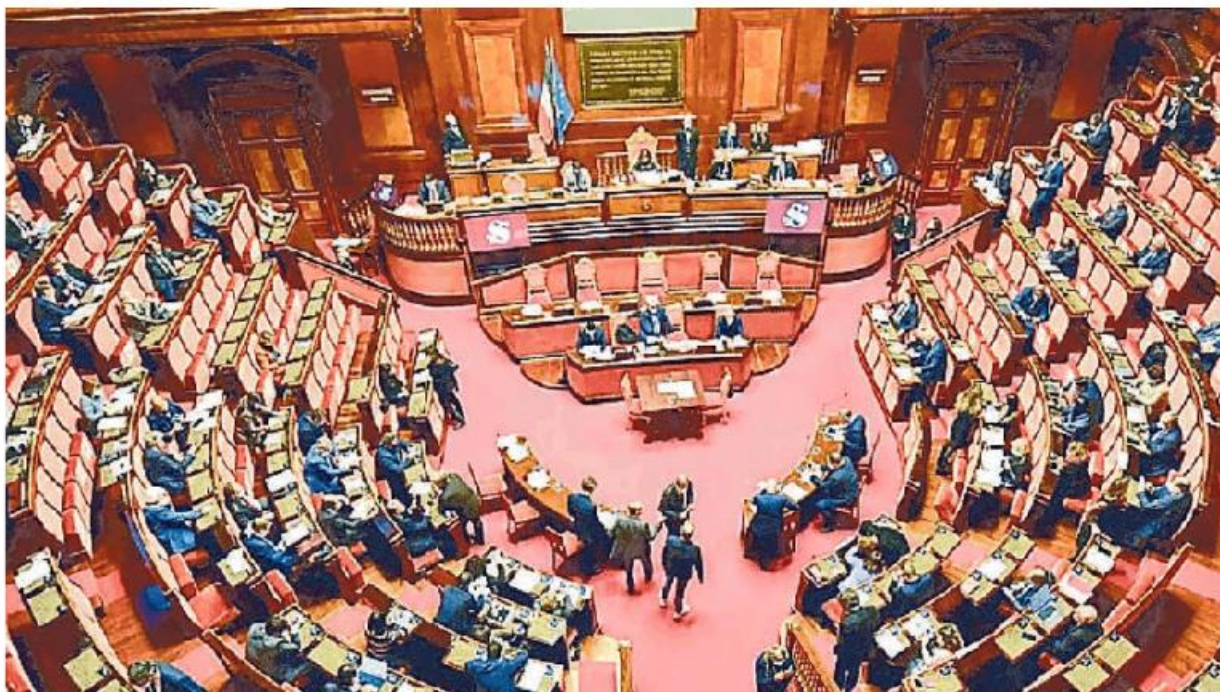
L'aula del Senato ha approvato il disegno di legge riguardante il mandato dei sindaci

nesio ed Uniti, Chignolo Po, Tromello, Torrevecchia Pia (unico al voto quest'anno), Bressana Bottarone, Godiasco e Varzi.