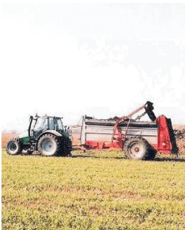
Lo spandimento di fanghi deve avvenire a 500 metri dalle case

«Si tratta di una sentenza importante _ spiega il vice sindaco Enrico Vignati _ perché