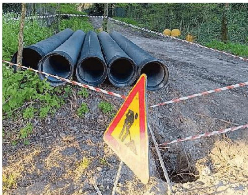
Fognature danneggiate durante i lavori, ecco i nuovi tubi da posare

«La ditta ha terminato i lavori e ha smantellato il cantiere ignorando quel piccolo cratere causato dal peso degli escavatori – spiegano i cittadini –. Senza dimenticare