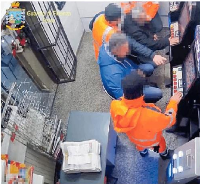
Un fermo immagini della Finanza durante le indagini iniziate nel 2019