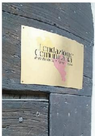
Via ai bandi della Fondazione

Quasi cinquecentomila euro destinati a progetti presentati dal Terzo settore. La Fondazione comunitaria ha pubblicato i primi quattro bandi del 2022, finanziati grazie ai fondi messi a disposizione da Fondazione Cariplo. Il primo riguarda l'assistenza sociale e i fondi a disposizione ammontano a 150mila euro. In particolare l'obiettivo è sostenere progetti che siano in grado di promuovere interventi di prossimità e