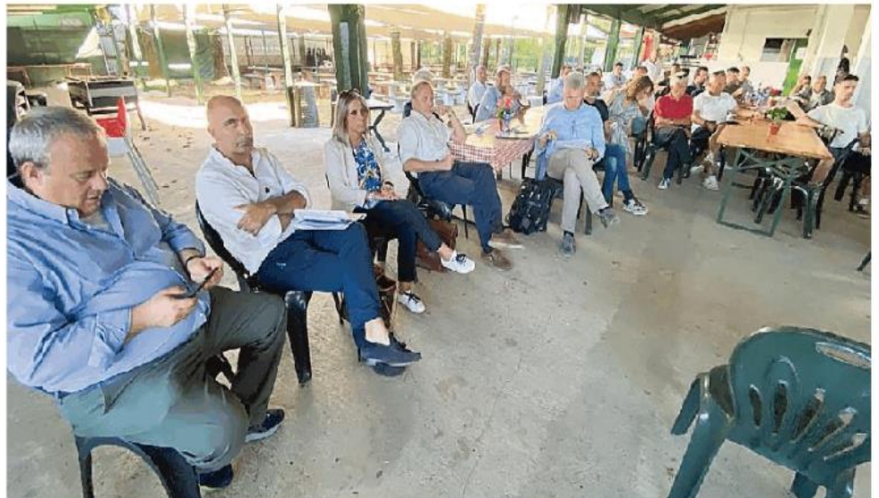
leri a Vigevano si sono confrontati categorie, operatori del settore, tecnici e politici su tema siccità