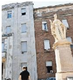
Il palazzo della Provincia

Sono partiti i lavori di recupero del cortile interno del palazzo della Provincia e di ristrutturazione di una delle facciate dell'edificio realizzato nel 1936. Un intervento dal costo complessivo di 200mila euro che ha l'obiettivo di restituire decoro ad una struttura su cui da tempo non si interveniva. Il