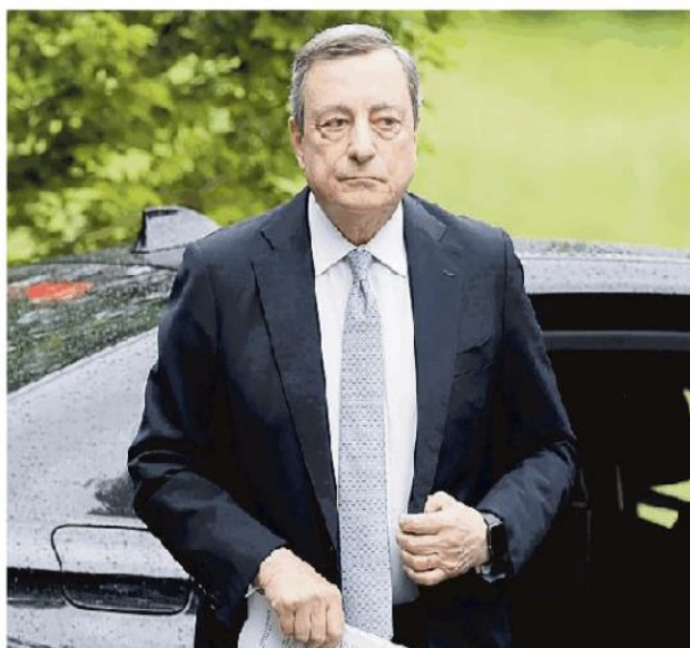
Il presidente del consiglio Draghi si è dimesso, Mattarella ha detto no

Per contro, la posizione formalizzata dall'ex presidente del Consiglio Giuseppe Conte, con le conseguenze sulla vita dell'esecutivo, attira i commenti al veleno dell'ex sindaco di Pavia, Alessandro Cattaneo («Pensavo tutto il male possibile dei 5 stelle e di Conte, ma mi hanno stupito in peggio») e di Elena Lucchini, de-