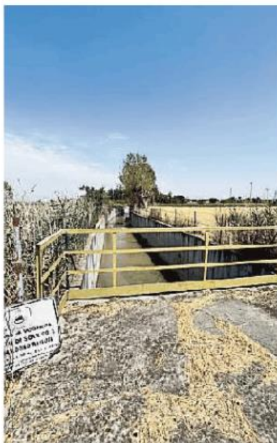
Il cavo Lagozzo

«L'intervento prevede l'adeguamento della sezione idraulica del canale in que-