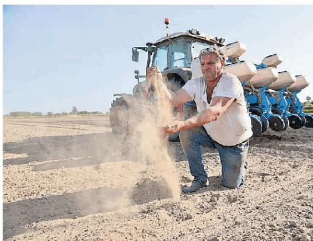
Dal 25 luglio potrebbe non arrivare più acqua nei campi

«Le ultime riserve per l'agricoltura - ha sottolineato il governatore della Lombardia - si stanno esaurendo e oltre il 25-30 luglio non possiamo andare. Per l'acqua potabile, grazie al cielo, la falda è ancora ricca e non abbiamo, per ora, preoccupazioni». «Con meno 61% di risorsa idrica ri-