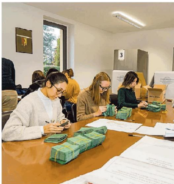
La preparazione delle schede per il voto sulla fusione tra Comuni

I seggi rimarranno aperti solo oggi, dalle 7 alle 23, e saranno chiamati al voto circa mille persone; lo spoglio delle schede avverrà subito dopo la chiusura delle urne e il risultato è atteso dopo mezzanotte. Due le schede che saranno consegnate agli elettori: una verde, sulla quale dovranno