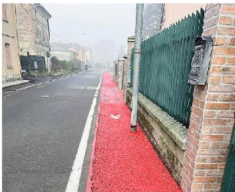
La pista pedonale realizzata a Casoni

Un progetto iniziato nel 2019 ad opera di Pavia Acque, dal costo complessivo di 820 mila euro. «Finalmente sono stati portati a conclusione i lavori per il collettamento della fognatura di Sartoro-