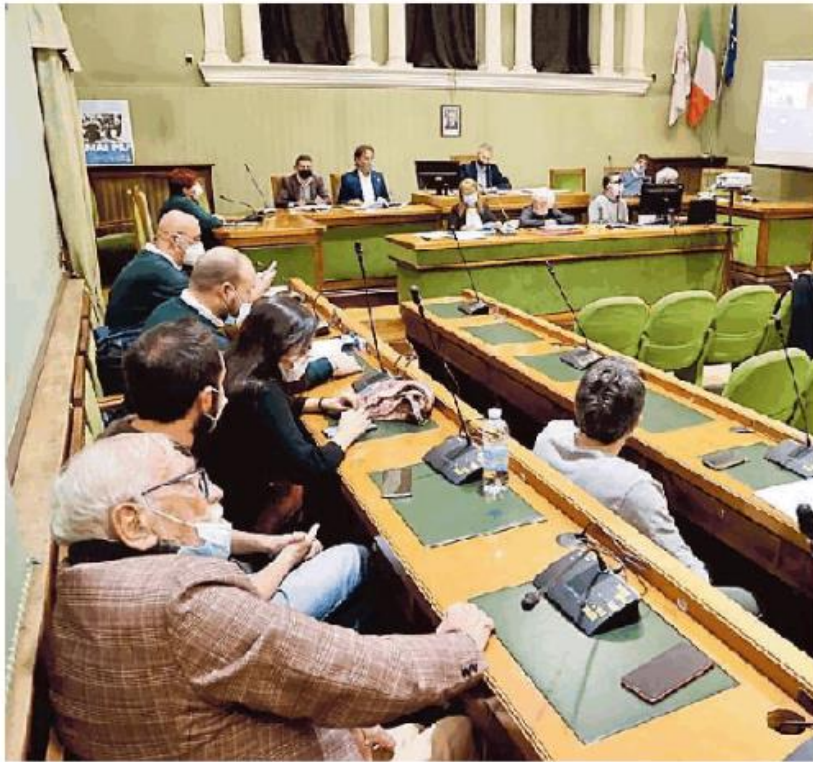
I banchi della minoranza in consiglio comunale

no la procedura impedendo il regolare svolgimento del servizio all'ufficio protocollo. È un gesto disperato, che dà la cifra del caos generale in cui si trova quella che fino a ieri era la maggioranza».