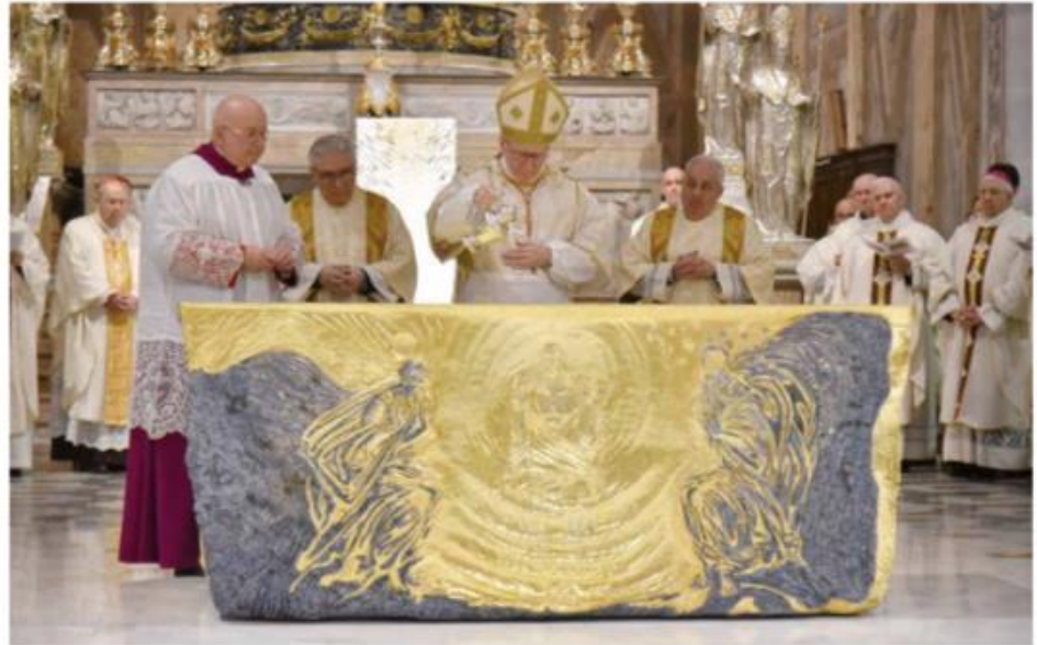
Un momento della celebrazione del cardinal Parolin sabato scorso in Cattedrale

VIGEVANO – L'inaugurazione e consacrazione del nuovo altare del duomo di Vigevano ha avuto sabato scorso come protagonista il cardinale Pietro Parolin, segretario di Stato vaticano. Una visita storica per la città. Parolin è la figura della chiesa cattolica più rappresentativa dopo quella del papa, il suo ruolo è decisivo per i rapporti della chiesa con le diplomazie degli stati nel mondo e nelle organizzazioni internazionali, oltre a presiedere tutti gli affari generali. Invitato dal vescovo monsignor Maurizio Gervasoni, ha accettato di visitare Vigevano e presiedere l'evento. Alle 15,30 il presule ha concelebrato con il cardinale Oscar Cantoni, vescovo di