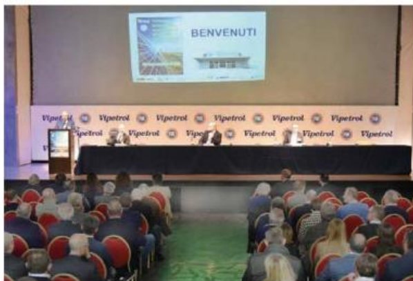
Un momento del convegno alla "Fabbrica dell'Energia"

il progresso è tecnologia. Ma occorre, anche questo è un concetto cardine, un gioco di squadra. Ed in campo dovranno esserci tutti, partendo dal basso, dai cittadini e coinvolgendo associazioni, politica, ricercatori, ingegneri, costruttori. «Siamo all'inizio dell'ennesima grande sfida». Una sfida che nessuno di noi deve perdere.