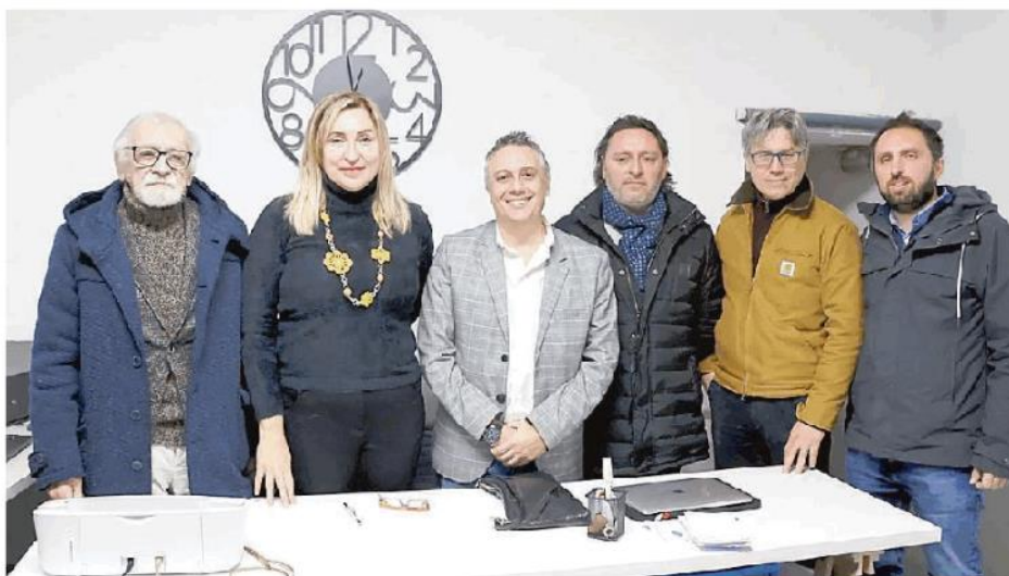
I rappresentanti della minoranza alla conferenza stampa in cui hanno illustrato l'esposto alla procura