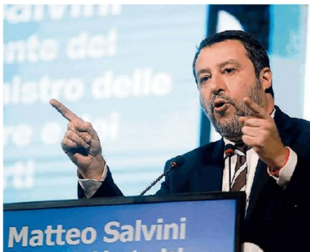
Il leader della Lega Matteo Salvini, ministro delle Infrastrutture

«Sono un segretario di partito felice perché, mentre mi occupo di infrastrutture, nella sola Lombardia si sono celebrati sei congressi provinciali che hanno coinvolto migliaia di militanti. Penso che siamo l'unica realtà politica capace di farlo. Nella Lega sta andando tutto bene». Il ministro delle Infrastrutture Matteo Salvini, a margine di una visita a Genova, interviene sul ritorno di Umberto Bossi sulla scena politica che sabato, al castello di Giovenzano, ha chiamato a raccolta quel popolo del Carroccio «smarrito e senza più identità». Il Capitano insiste: «Chiunque ne esca vincitore, sono felice che diventi segretario. Siamo assi-