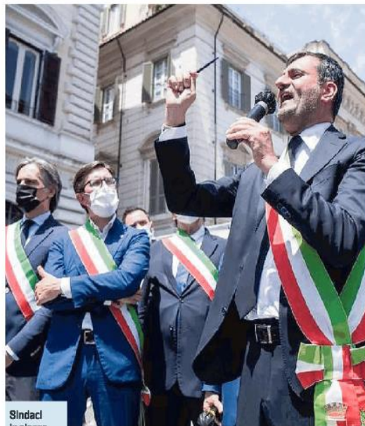
Sindaci in piazza durante una giornata di protesta a Roma (foto di archivio)

le esattoriali fino a 1.000 euro che cancella «entrate potenziali per circa 300 milioni». Per fronteggiare queste mancate entrate, l'Anci chiede «uno stanziamento di almeno 80 milioni».