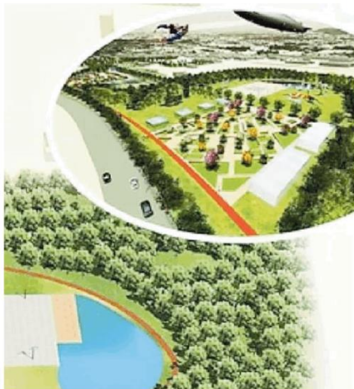
Il Parco Baratta nella simulazione dello Studio Metamorphosys

La legge regionale, nel 2014, aveva inserito chiare indicazioni sulla diminuzione del consumo di suolo. Così si può consumare suolo «solo dopo aver dimostrato l'insostenibili-