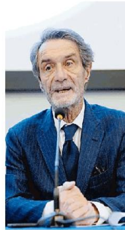
Attilio Fontana (Lega)