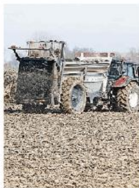
Fanghi gettati nei campi

Fanghi in aumento anche con la spinta delle sentenze favorevoli ai fanghisti. Quella che sta iniziando è la prima stagione di se-