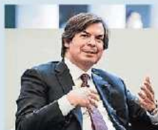
Carlo Messina (Intesa Sanpaolo)

«Per combattere la povertà e le disuguaglianze in Italia è necessario che qualcosa venga fatto a livello di Governo e di pubblico». A dirlo, in maniera diretta e senza giri di parole, è l'amministratore delegato di Intesa Sanpaolo, Carlo Messina intervenuto ieri alla presentazione del rapporto sulle disuguaglianze della Fondazione Cariplo: «È un cazzotto nello stomaco» ha aggiunto il banchiere. Per Messina, in particolare «se tutti si muovono con questo spirito contribuiamo a far avvenire le cose,