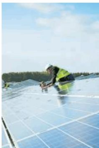
Un impianto fotovoltaico

Circa il 60% dei fornitori di componentistica per i fotovoltaici è italiano e la Lombardia primeggia per numero di impianti e imprese installatrici. Da un'indagine commissionata da Gis (Gruppo Impianti Solari) per approfondire il panorama delle imprese operanti nel mercato italiano del fotovoltaico, la Lombardia emerge come prima regione sia per numero di impianti sia per imprese che li installano.