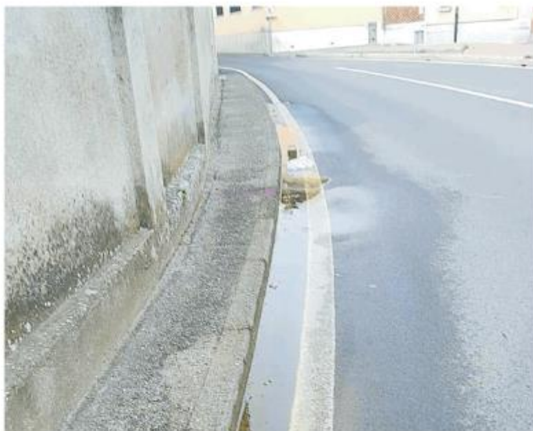
La perdita da una tubatura in via Vittorio Emanuele