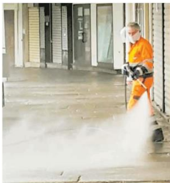
Un operai di Asm al lavoro in piazza Duomo

Ma veniamo ai fatti. Il tema centrale era quello della sicurezza del lavoro, declinato in due diverse vicende comunque collegate. La prima riguarda l'orario estivo. Un accordo precedente, ora disat-