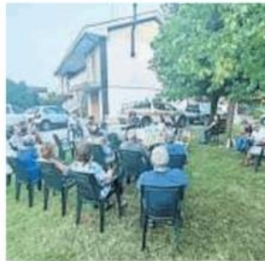
L'incontro alla frazione Casottelli

Il tratto di fognatura anche nel centro della frazione. A chiederlo al Comune sono stati i residenti della località Casottelli, nel corso dell'ultimo incontro organizzato nelle zone periferiche della città dagli amministratori. Ad oggi, infatti, la fognatura è presente solamente dalla stazione di