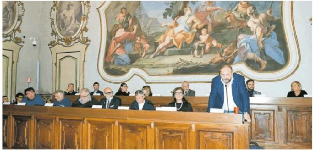
I consiglieri comunali stanno discutendo del tema delle eventuali incompatibilità rispetto al voto espresso in sede di adozione del nuovo Pgt

Un modo elegante per dire ai consiglieri comunali di arrendersi e rispetto al quale,