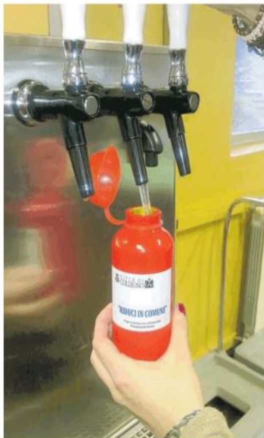
Un distributore di acqua depurata per ridurre l'uso della plastica

Il nuovo distributore sarà fruibile fino da subito. L'installazione è stata possibile