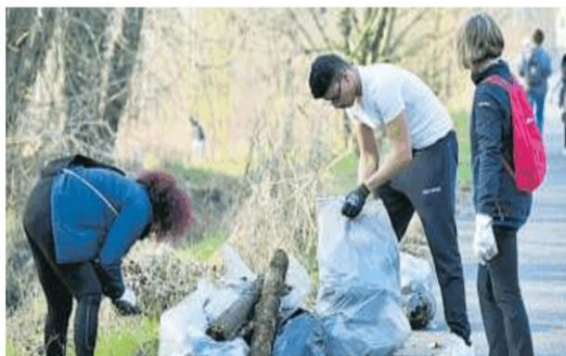
Volontari impegnati nella raccolta di rifiuti di plastica

Educare e sensibilizzare i giovani alla tutela dell'ambiente e alla cultura della sostenibilità. È questo l'obiettivo della Provincia, che insieme a Fondazione Adolescere di Voghera, Slow Food Oltrepo Pavese e ad alcune scuole del territorio, coinvolgendo circa 300 studenti, ha deciso di partecipare al settimo bando Ambiente e Territorio, promosso