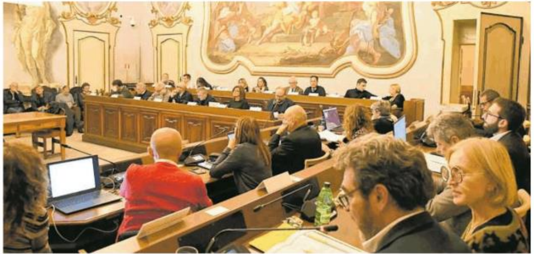
Ci sono ancora venti giorni utili e quattro sedute di Consiglio per arrivare all'approvazione definitiva del Piano di governo del territorio