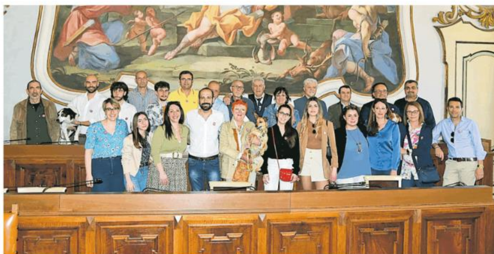
Foto di gruppo dei candidati della lista civica "Cittadini per Pavia" presentata ieri in Comune

È stato Depaoli, ieri nella sala consiliare, a officiare la presentazione della "sua" lista, che vede una buona percentuale di giovani ed è a forte trazione medico-ospedaliera (rappresenta infatti una quota e importante dei 31 candidati in lista) grazie al gran lavoro fatto da