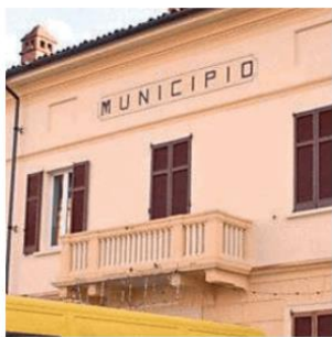
Il Comune di San Giorgio