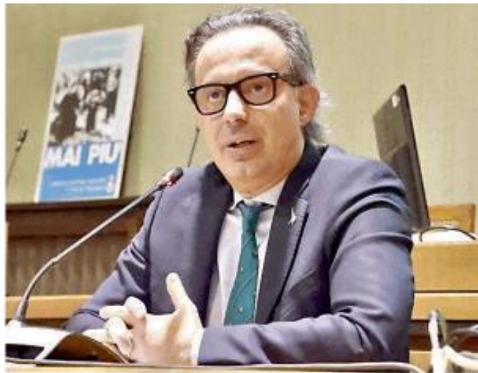
Il sindaco Andrea Ceffa resta la suo posto

ta e il sindaco di Vigevano restano al loro posto. Ceffa però dovrà affrontare la parte finale del mandato (che potrebbe concludersi secondo alcune fonti nella tarda primavera 2026, con un mandato di oltre cinque anni e mezzo quindi) basandosi su una maggioranza risicata: 13 consiglieri contro 12, con il rischio che in qualsiasi momento si possa trovare in minoranza.