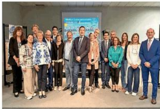
Sopra la lista di Bellinzona, sotto quella di Cantù

ziale). Tra le opere pubbliche, priorità al cavalcavia del Corriggio, alla realizzazione della rotatoria dell'ospedale, al completamento della gronda, alla manutenzione del centro polifunzionale. «Vogliamo ridefinire con gli operatori del commercio le manifestazioni storiche per far tornare a vivere Stradella» ha aggiun-