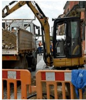
Lavori Asm a Bagnaria (archivio)

Opere che riguardano asfaltature di strade e l'installazione di un eco-compattatore per la raccolta della plastica. Nelle prossime settimane prenderanno il via i lavori di