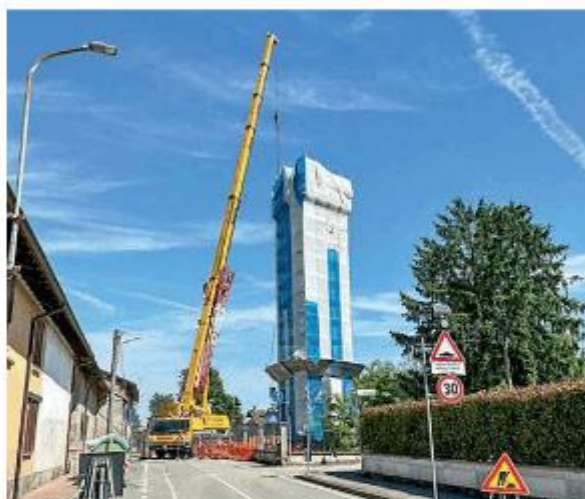
Il cantiere in via Grisini per la demolizione della torre dell'acqua

Si tratta di una delle cosiddette torri piezometriche, utilizzate in passato per ospitare serbatoi per l'accumulo d'acqua, ma che con il passare del tempo sono state via via dismesse. Oltre a non essere più utilizzata, quella di via Grisini necessitava di una messa in sicurezza urgente, visto che il Comune aveva segnalato la caduta di calcinacci, che potevano costituire un pericolo, data la vicinanza con le case e con la viabilità pubblica. «Sul territorio di Campospinoso Albarredo c'era un'altra torre di questo tipo, in località Fornace, che è stata demolita - spiega la sindaca del paese, Olga Volpin -. Per quanto riguarda quella di via Grisini, da tempo avevo sollecitato Pavia Acque chiedendone la rimozione, visto che c'erano state segnalazioni di caduta di calcinacci. I lavori dovevano iniziare già in autunno, ma i tempi di sono prolungati per le procedure di assegnazione. In ogni caso, fortunatamente, i lavori sono partiti e presto la torre sarà de-