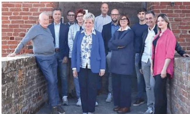
Si è presentata la lista che appoggia la sindaca Silvia Ruggia