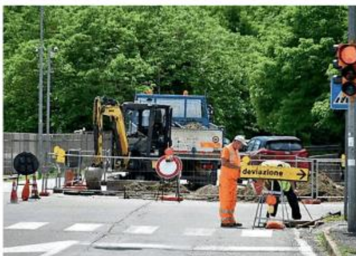
L'incrocio sulla direttrice viale Campari-viale Lodi