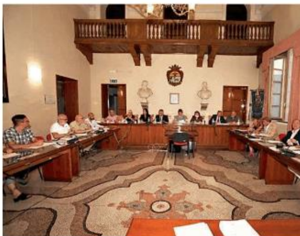
Il consiglio comunale di Mortara ha votato il bilancio

Giovedì, infatti, è passato il bilancio consuntivo. Era la terza volta che la maggioranza provava ad approvare il