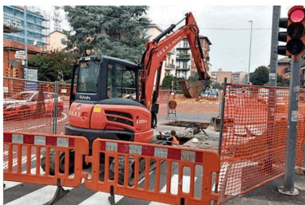
Il cantiere che restringe la strada nel tratto via San Paolo-via Ferrini

La scorsa settimana era stata delimitata l'area, mentre ieri sono partiti i lavori. Sul posto è intervenuta la ruspa che ha iniziato lo scavo all'altezza del semaforo tra via San Paolo e via Ferrini. I tecnici stanno sistemando la condotta che si è rotta in un punto vicino alla stazio-